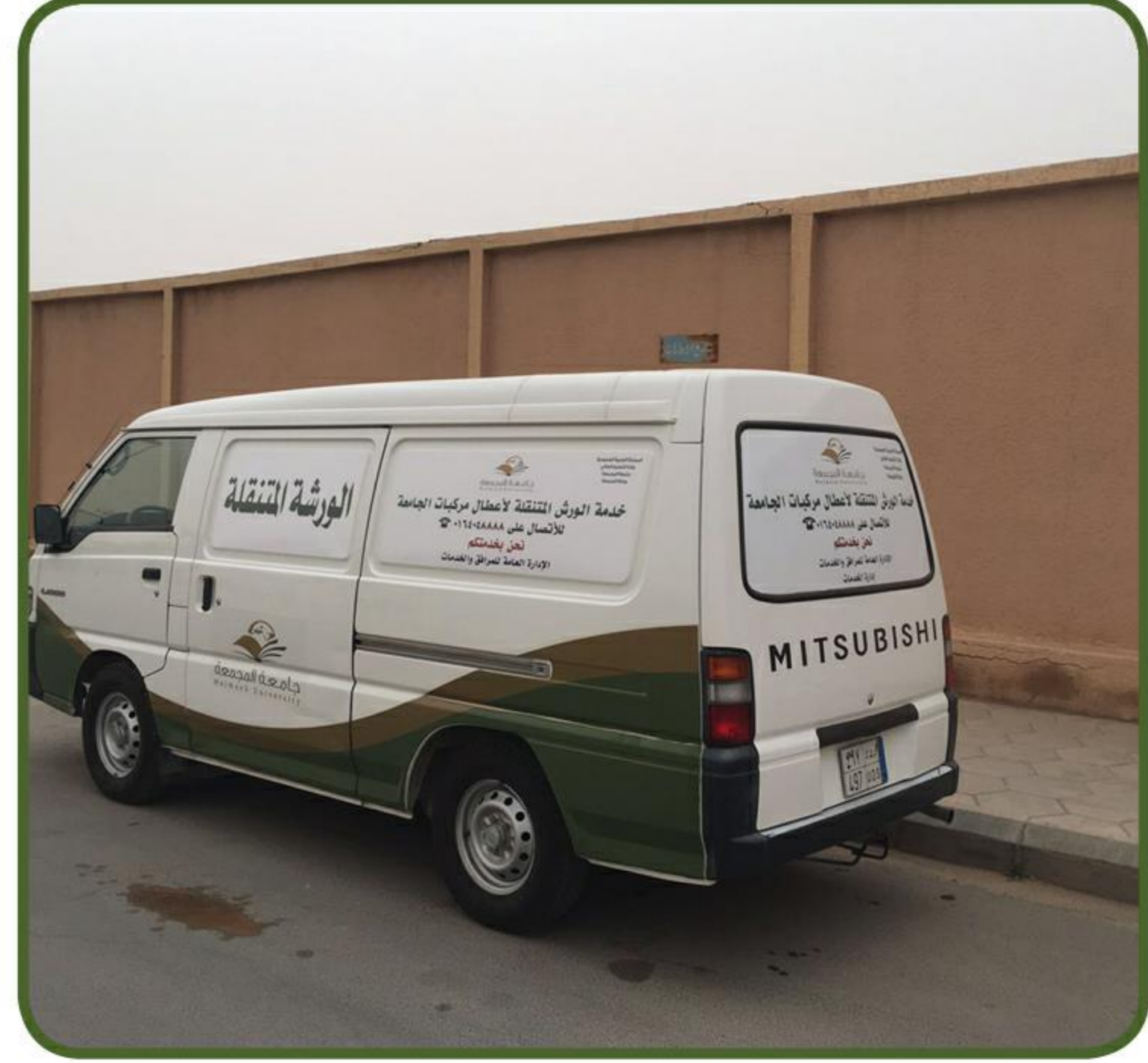
تجهيز ورشة متنقلة لاعطال مركبات الجامعة وتخصيص رقم موحد لهذا الخدمة.