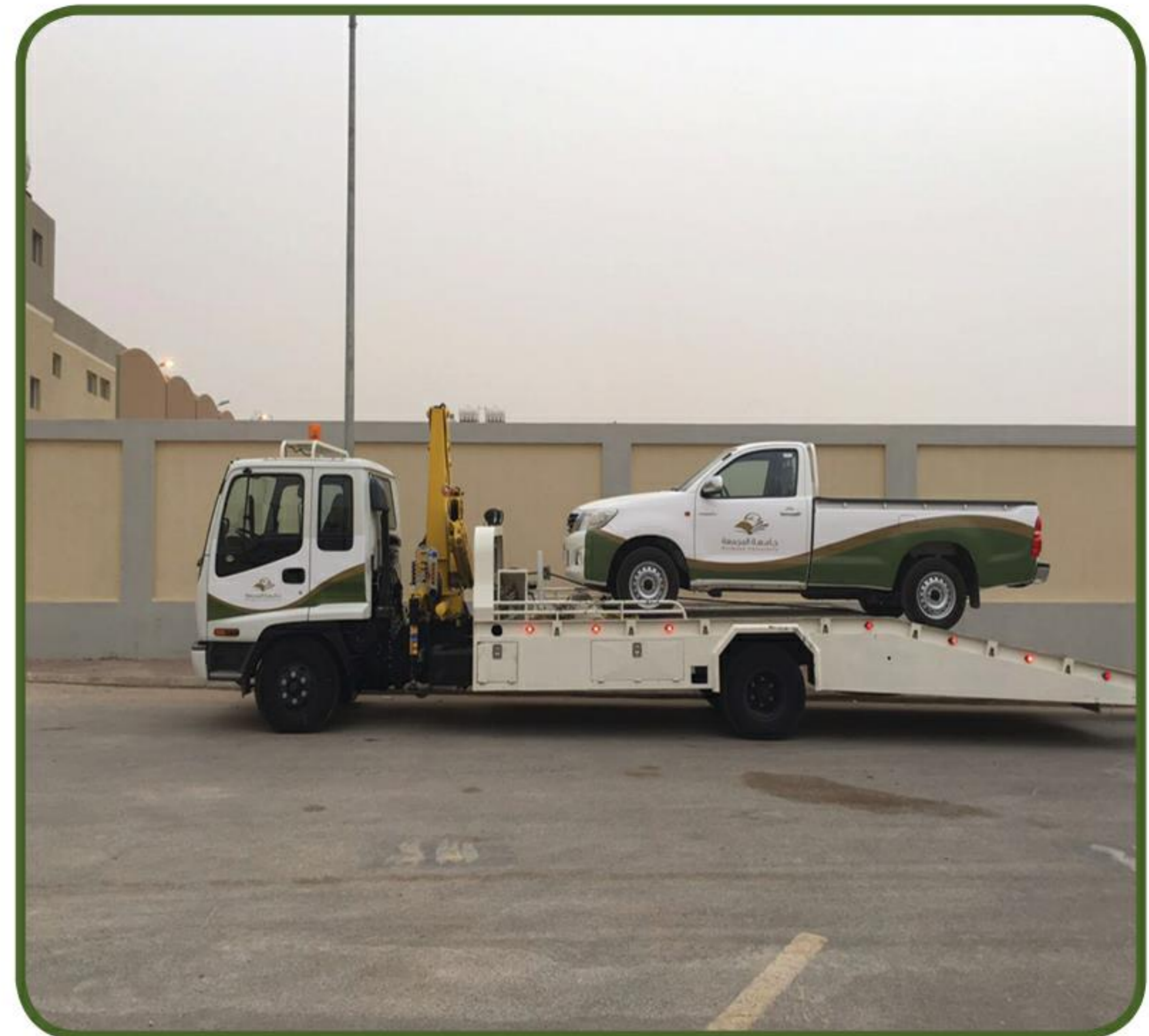
توفير وسيلة نقل بمواصفات عالية تحتوي على خدمة حمل السيارات المتعطلة وايضاً لرفع البضائع او الغرف المتنقلة وتقديم الخدمة لطلابها.