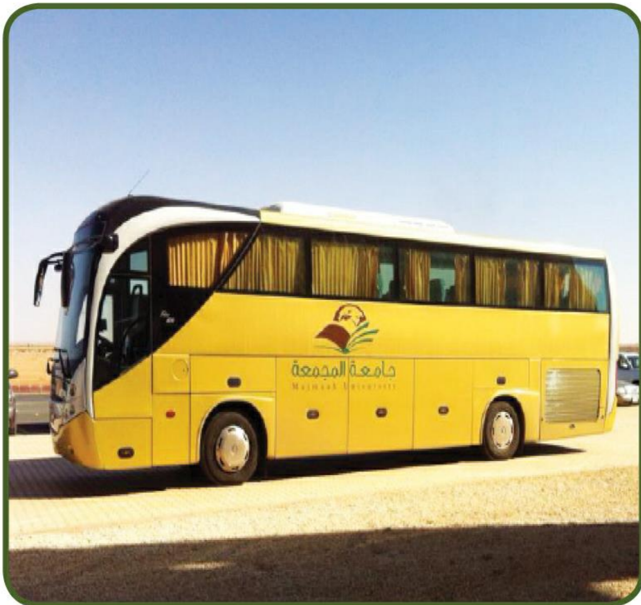
المساهمة بخدمة تنقل الوفود والضيوف عبر حافلة النقل الجامعي.