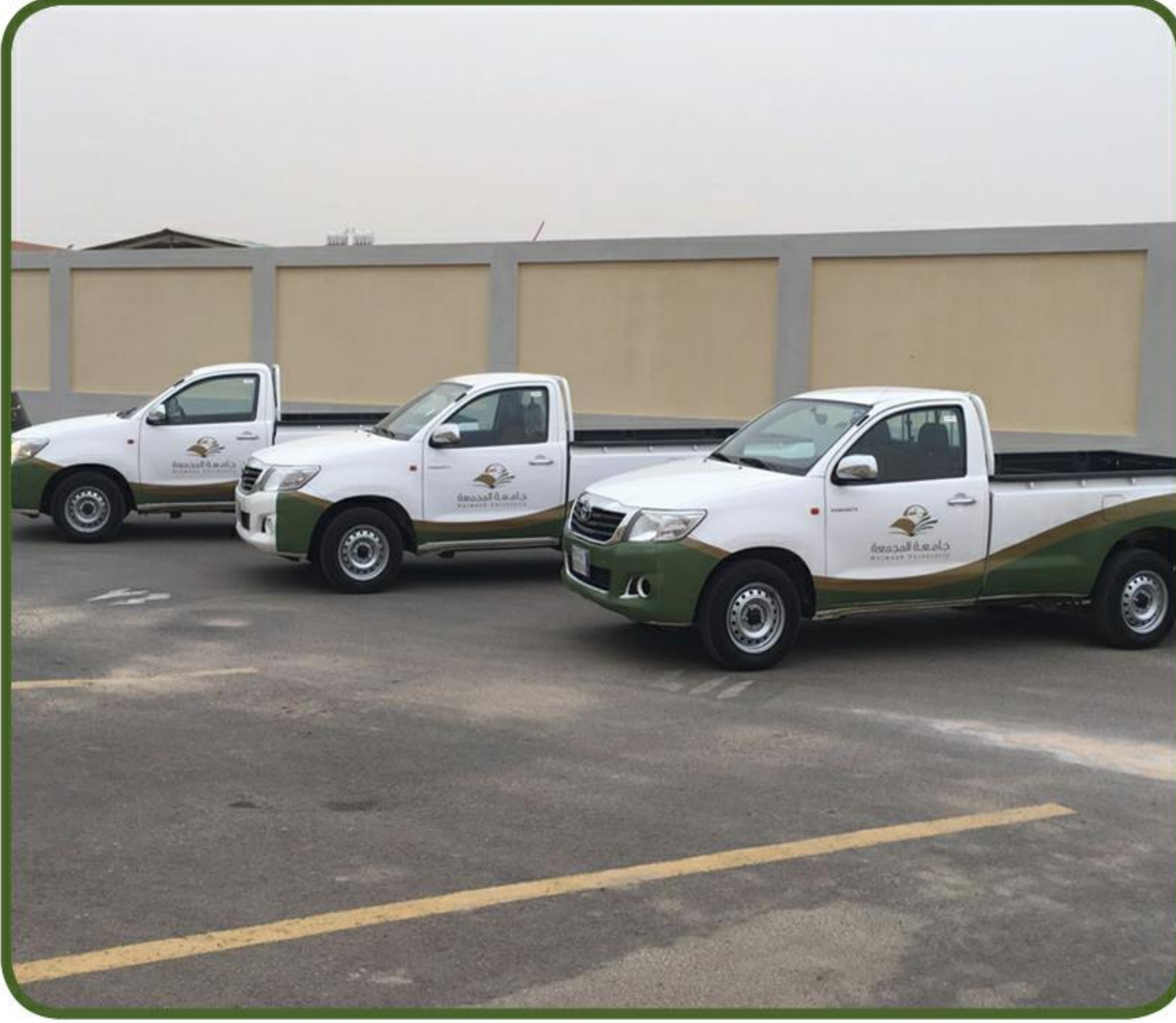
توفير عدد من وسائل النقل للخدمة لنقل البضائع والأثاث وخلافه.