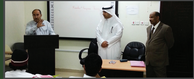
حفل استقبال الطلاب الجدد بالقسم