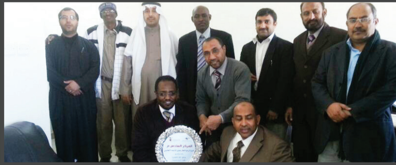
احتفال بمناسبة حصول القسم على المركز السادس في مسابقة معالي مدير الجامعة للبرامج الأكثر جاهزية للإعتماد الأكاديمي