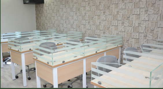
معامل قسم اللغة الانجليزية , قسم الطلاب