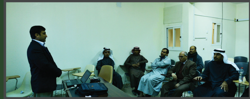
أحدى حلقات النقاش الدورية