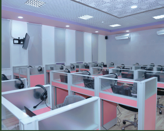
معامل قسم اللغة الانجليزية , قسم الطالبات

المواصفات العالمية الخاصة بمعامل اللغة ، كما روعي أن تكون هذه المعامل ذات تصميم مناسب للطلبة حيث يقضي الطلاب ٤٠٪ من ساعاتهم الدراسية في المعامل ، كما جهزت هذه المعامل ببرامج تساعد أساتذة المقررات على تدريب الطلبة بجميع المهارات المتعلقة باللغة الإنجليزية وكذلك وضع الاختبارات والواجبات منزلية . سائلين لله تعالى أن ينفع بهذه الجهود المبذولة أبناءنا وبناتنا من الطلاب والطالبات بما يعود على خدمة وطننا الغالي .