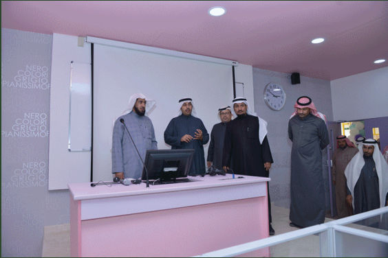
سعادة وكيل الجامعة يفتتح معامل اللغة الانجليزية , قسم الطالبات برفقة سعادة عميد الكلية وسعادة المشرف على القسم