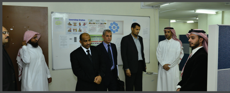
زيارة لجنة تقييم البرامج الأكثر جاهزية للإعتماد الأكاديمي