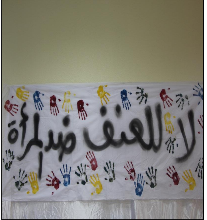
التغطية الإعلامية : أبشرى الحشيري ، أخلود الحريص .